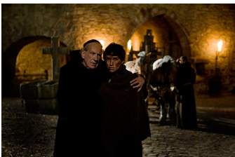
Black Death (Goseck)