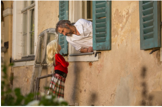
Allein unter Schwestern