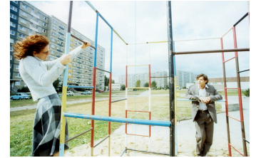
Die Stille nach dem Schuß

Filmdatenbank der MDM unter www.mdm-online.de > Drehreport