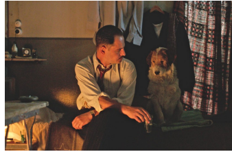
Es war einmal in Deutschland...