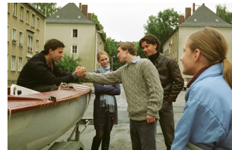
Go West - Freiheit um jeden Preis