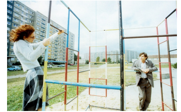
Die Stille nach dem Schuß

Filmdatenbank der MDM unter www.mdm-online.de > Drehreport