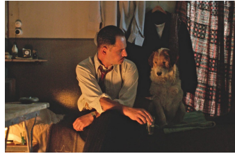
Es war einmal in Deutschland...