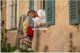
Allein unter Schwestern