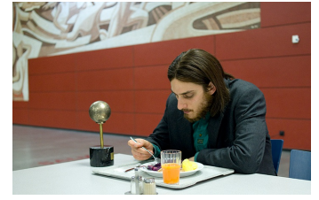
Die Einsamkeit der Primzahlen