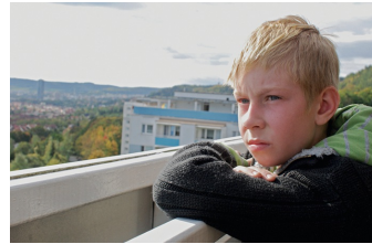
Das verlorene Lachen