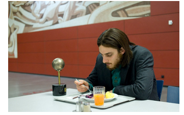
Die Einsamkeit der Primzahlen