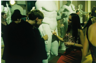
Vaya con dios