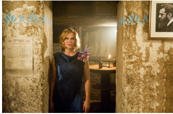
Nacht über Berlin