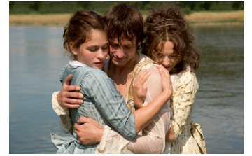
Die geliebten Schwestern