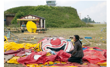
Tatort, Episode: Absturz

Filmdatenbank der MDM unter www.mdm-online.de > Drehreport