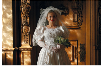
Der Mond und andere Liebhaber