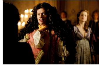
Mätressen – Die geheime Macht der Frauen