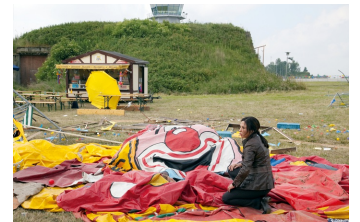
Tatort, Episode: Absturz

Filmdatenbank der MDM unter www.mdm-online.de > Drehreport