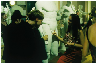
Vaya con dios