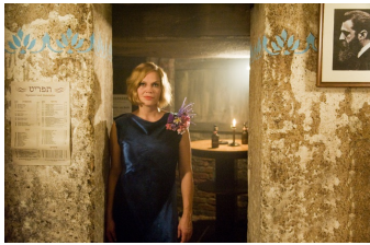
Nacht über Berlin