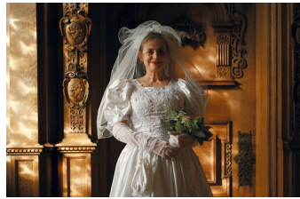
Der Mond und andere Liebhaber