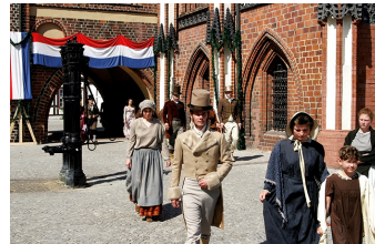
Napoleon und die Deutschen