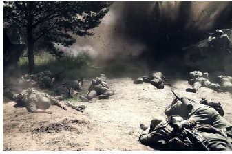
Wir waren Kameraden - das Ende