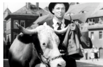
Der Ochse von Kulm

Liste von Dreharbeiten in der Stadt Görlitz www.goerlitz.de/Goerliwood-Filmografie.html