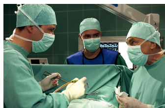
In aller Freundschaft