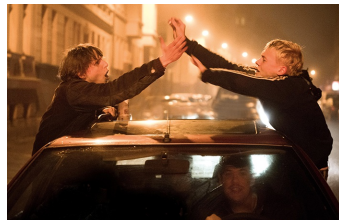
Als wir träumten