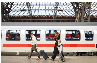
Circles | Kreise