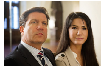
Ein Fall von Liebe