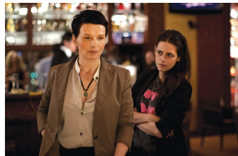
Die Wolken von Sils Maria