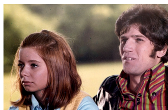
Du und ich und Klein-Paris