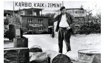
Karbid und Sauerampfer (DEFA 1963)

Filmdatenbank der MDM unter: www.mdm-online.de > Film Commission > Drehreport