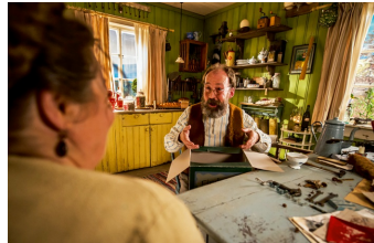
Petterson und Findus