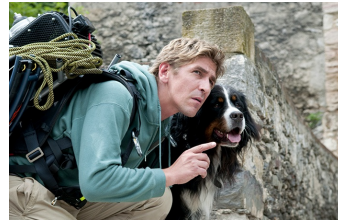
Löwenzahn – Das Kinoabenteuer