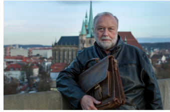
Der namenlose Tag