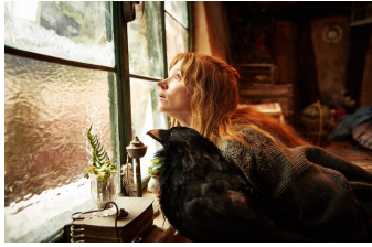
Die kleine Hexe