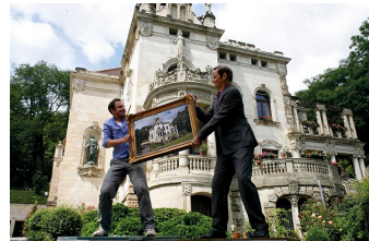
Wie erziehe ich meine Eltern