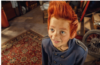
Doktor Proktors Puspulver