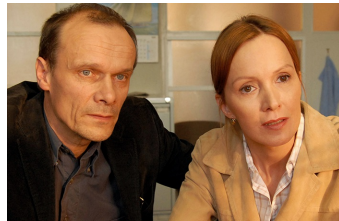
Jenseits der Mauer