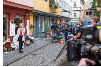
In aller Freundschaft – Die jungen Ärzte