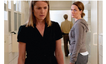
Das letzte Schweigen