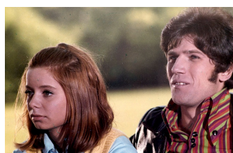
Du und ich und Klein-Paris