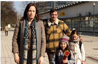
Circles | Kreise