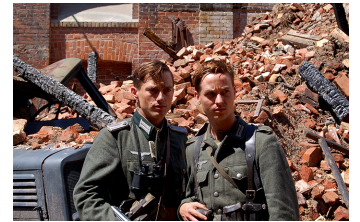
Unsere Mütter, unsere Väter