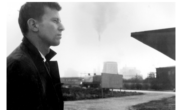
Der geteilte Himmel

Film Datenbank der MDM unter www.mdm-online.de > Film Commission > Drehreport