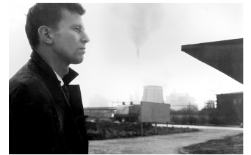
Der geteilte Himmel

Film Datenbank der MDM unter www.mdm-online.de > Film Commission > Drehreport