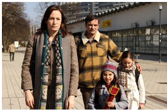
Circles | Kreise