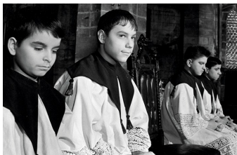
Engel im Fegefeuer