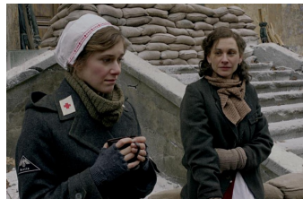
Unsere Mütter, unsere Väter (Zeitz)