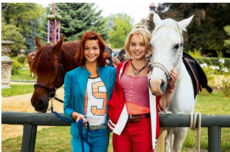
Bibi und Tina - Der Film (Vitzenburg)