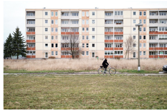
Das Mädchen mit den goldenen Händen (Zeitz)