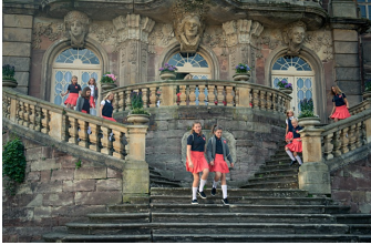
Hanni & Nanni - Mehr als beste Freunde (Burgscheidungen)