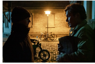
Die unheimliche Leichtigkeit der Revolution (Weißenfels)