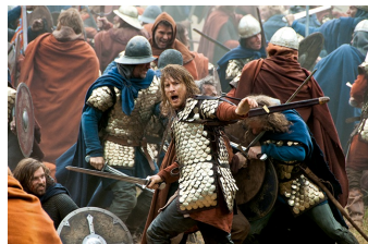
Die Päpstin (Schulpforte)