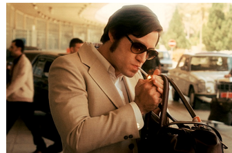
Carlos - Der Schakal (Naumburg)