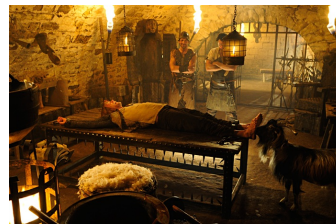
1 ½ Ritter - Auf der Suche nach der hinreißenden Herzelinde (Eckartsberga)