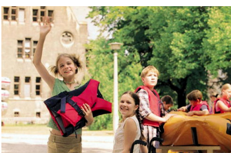
Bibi Blocksberg und das Geheimnis der blauen Eulen