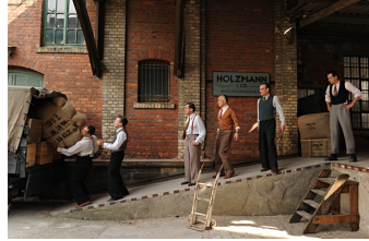
Es war einmal in Deutschland... (Weißenfels)