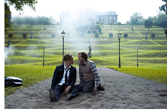
Der Nanny (Burgscheidungen)