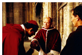
Die geheime Inquisition (Memleben, Schulpforte, Zeitz)