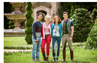
Bibi und Tina - Voll verhext (Vitzenburg)