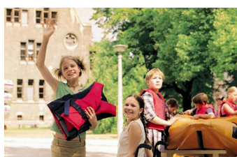
Bibi Blocksberg und das Geheimnis der blauen Eulen