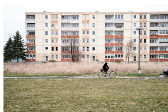
Das Mädchen mit den goldenen Händen (Zeitz)