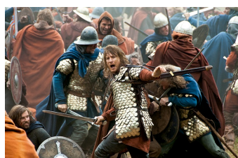
Die Päpstin (Schulpforte)