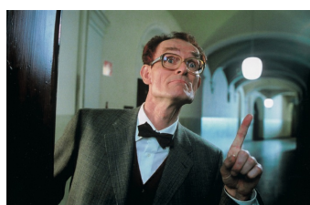
Das fliegende Klassenzimmer (Schulpforte)