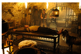
1 ½ Ritter - Auf der Suche nach der hinreißenden Herzelinde (Eckartsberga)