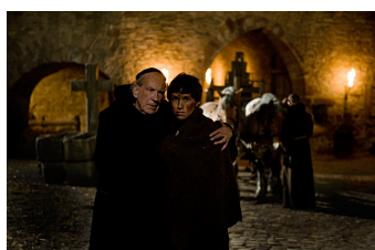
Black Death (Goseck)