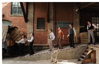
Es war einmal in Deutschland... (Weißenfels)