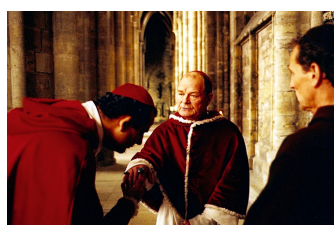
Die geheime Inquisition (Memleben, Schulpforte, Zeitz)