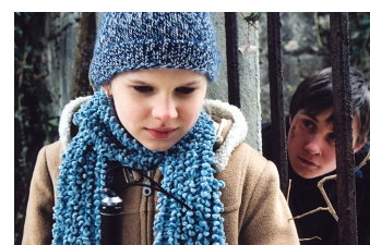
Die Blindgänger (Schulpforte)

Filmdatenbank der MDM unter: www.mdm-online.de > Film Commission > Drehreport