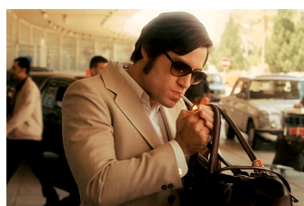
Carlos - Der Schakal (Naumburg)