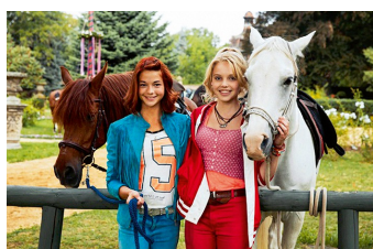
Bibi und Tina - Der Film (Vitzenburg)