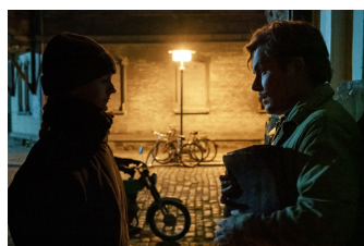
Die unheimliche Leichtigkeit der Revolution (Weißenfels)