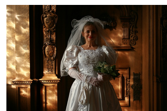
Der Mond und andere Liebhaber (Zeitz)