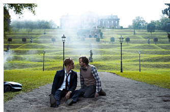
Der Nanny (Burgscheidungen)