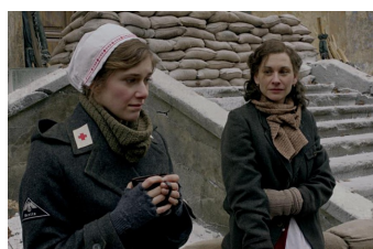
Unsere Mütter, unsere Väter (Zeitz)