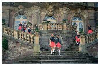
Hanni & Nanni - Mehr als beste Freunde (Burgscheidungen)