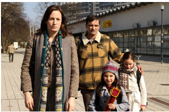
Circles | Kreise