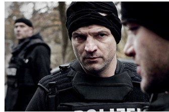
Wir waren Könige