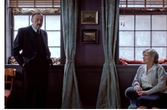
Vor der Morgenröte