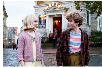
Timm Thaler oder das verkaufte Lachen