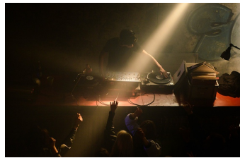
Als wir träumten