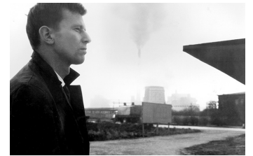
Der geteilte Himmel

Film Datenbank der MDM unter www.mdm-online.de > Film Commission > Drehreport