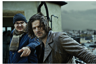
Zorn - Tod und Regen