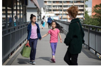
Ente Gut! Mädchen allein zu Haus