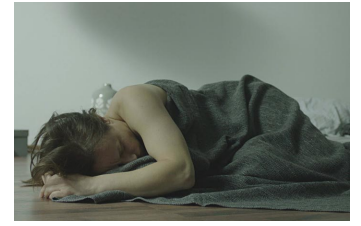
Einsamkeit und Sex und Mitleid