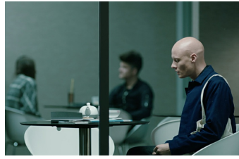
Touch me not