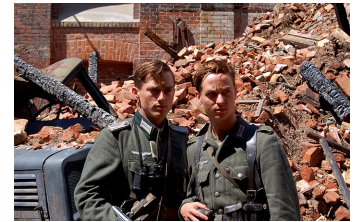
Unsere Mütter, unsere Väter