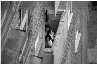
Wir sind jung. Wir sind stark.