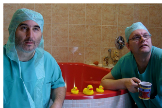
Der lange Weg ans Licht