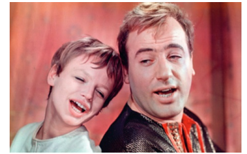
Frau Venus und ihr Teufel

Filmdatenbank der MDM unter www.mdm-online.de > Drehreport