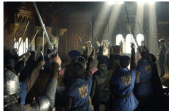
Der Brief für den König