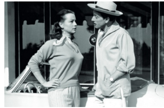
Rivalen am Steuer