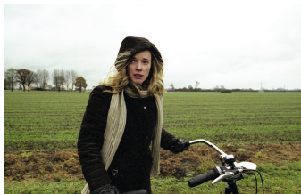
Die Zeit nach der Trauer