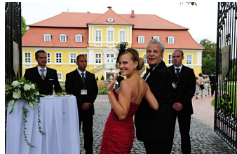
Mann tut was Mann kann