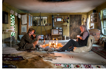
Axel der Held