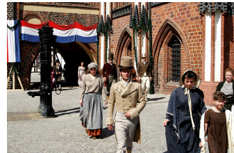
Napoleon und die Deutschen