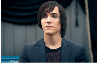
Besser als nix