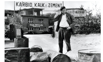
Karbid und Sauerampfer (DEFA 1963)

Filmdatenbank der MDM unter: www.mdm-online.de > Film Commission > Drehreport