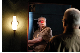
Nachts in Monte Carlo