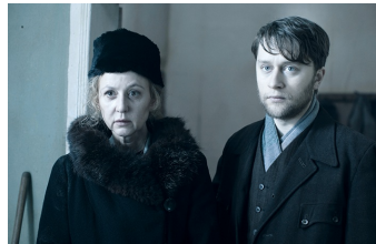
Die verlorene Zeit