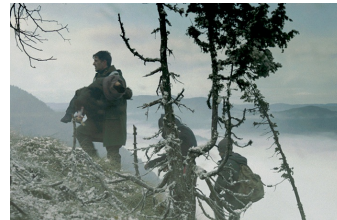
Judgment - Grenze der Hoffnung