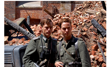
Unsere Mütter, unsere Väter