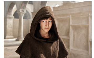
Die Päpstin (Ilseburg)