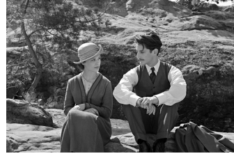
Frantz (Quedlinburg, Wernigerode)