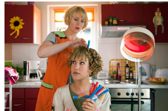
Heiter bis tödlich - Alles Klara