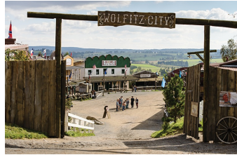
Winnetous Sohn (Halberstadt, Thale)