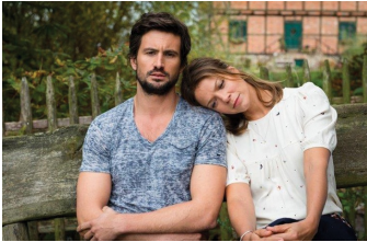
Stadlandliebe (Falkenstein, Quedlinburg)