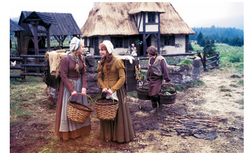
Schneeweißchen und Rosenrot (DEFA 1979)

Filmdatenbank der MDM unter: www.mdm-online.de > Film Commission > Drehreport