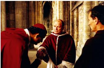
Die geheime Inquisition (Falkenstein, Gernrode, Halberstadt)