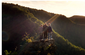
Wenn die Welt uns gehört (Halberstadt)