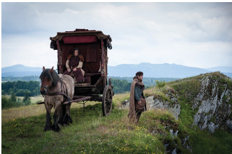
Der Medicus (Harsleben)