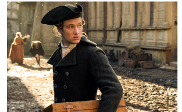
Goethe! (Osterwieck, Quedlinburg)