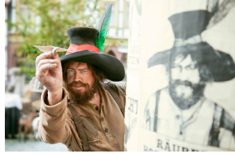
Der Räuber Hotzenplotz (Blankenburg, Quedlinburg, Langenstein)