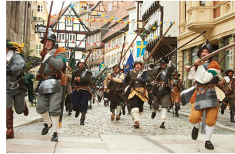
Das kleine Gespenst (Quedlinburg, Wernigerode)