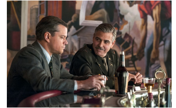
The Monuments Men (Halberstadt, Osterwieck)