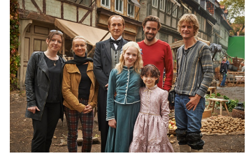
Heidi (Halberstadt, Quedlinburg)