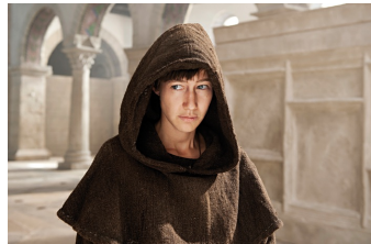
Die Päpstin (Gernrode, Harzgerode)