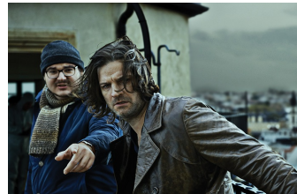
Zorn - Tod und Regen