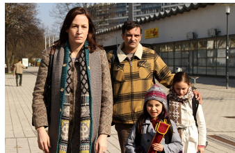
Circles | Kreise