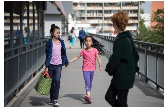
Ente Gut! Mädchen allein zu Haus