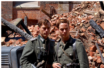
Unsere Mütter, unsere Väter