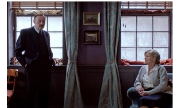
Vor der Morgenröte