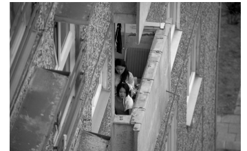
Wir sind jung. Wir sind stark.