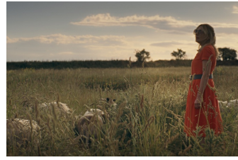
More than Strangers