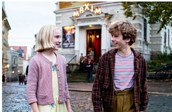
Timm Thaler oder das verkaufte Lachen