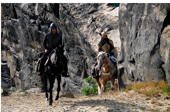
1 1/2 Ritter - Auf der Suche nach der hinreißenden Herzeliinde (Blankenburg, Thale)