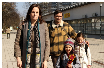
Circles | Kreise