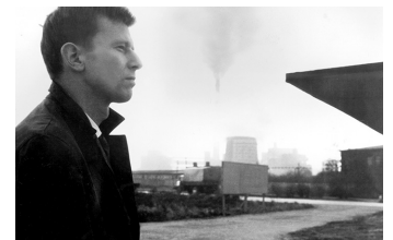
Der geteilte Himmel

Filmdatenbank der MDM unter www.mdm-online.de > Film Commission > Drehreport