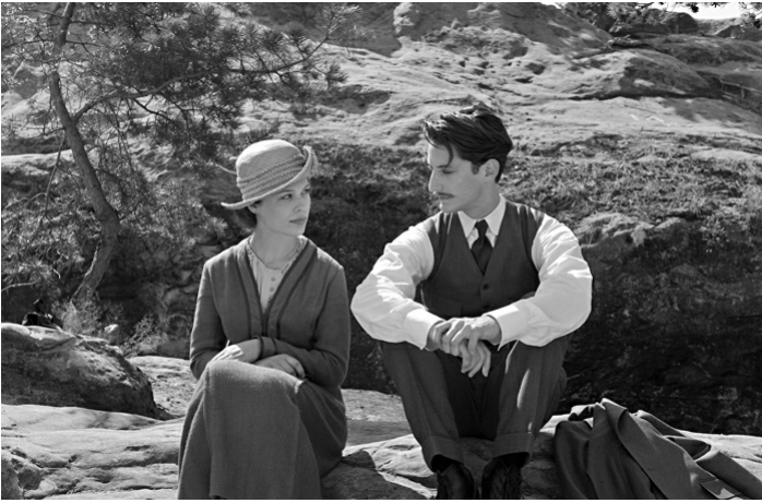
Frantz (Quedlinburg, Wernigerode)