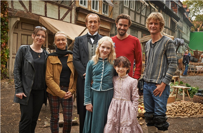
Heidi (Halberstadt, Quedlinburg)