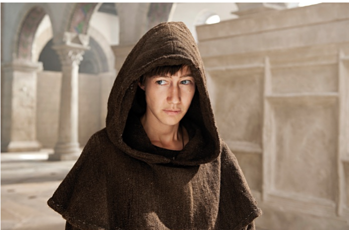
Die Päpstin (Gernrode, Harzgerode)