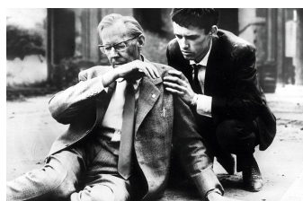
Denk bloß nicht, ich heule