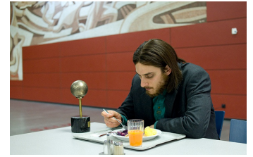
Die Einsamkeit der Primzahlen